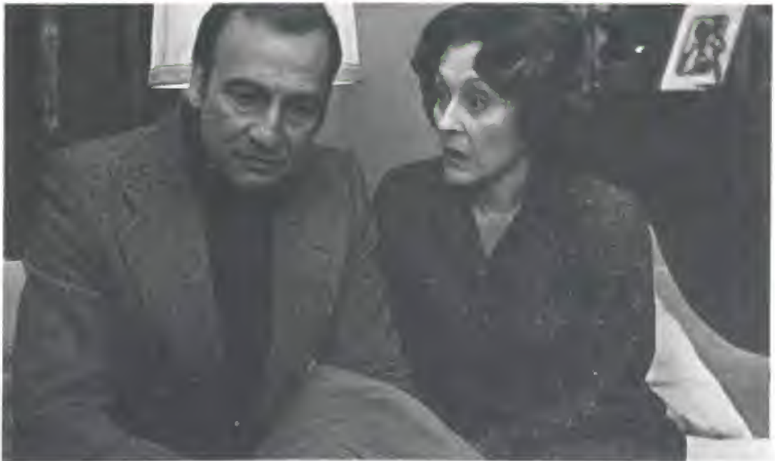
Héctor Alterio - Irene Gutiérrez Caba